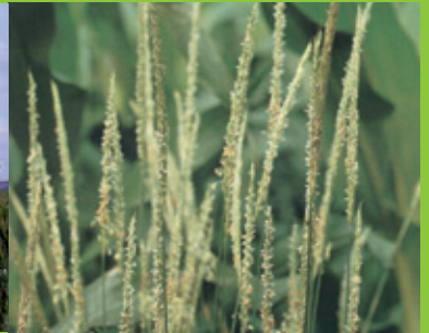
Vulpin au stade plantule

Importé et distribué en Algérie par : ACI AgroConsulting 194 Rue Boudjemâa khellil Oued Romane, El Achour - Alger. Tél: 021 30 81 63 à 66 Fax : 021 30 83 66 Mail : info@aci-algerie.com Web : www.aci-algerie.com